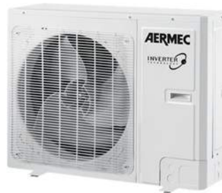
LCG 1200 T/1400 T

Split-Kassettenklimageräte in Wärmepumpenausführung