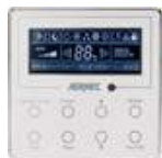
Kabel- Fernbedienung (Zubehör)