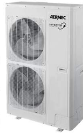
LCG 1600 T