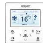
Kabel-Fernbedienung WRC 30 mit Wochentimer (Zubehör)