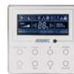
Kabel-Fernbedienung WRC 20 (Zubehör)

Wie bei allen anderen Geräten der LCG-Serie, gehört eine Infrarotfernbedienung zum Standard-Lieferumfang. Im Zubehör ist die Basis-Kabelfernbedienung WRC 20 und die Kabelfernbedienung mit Wochentimer WRC 30 erhältlich.